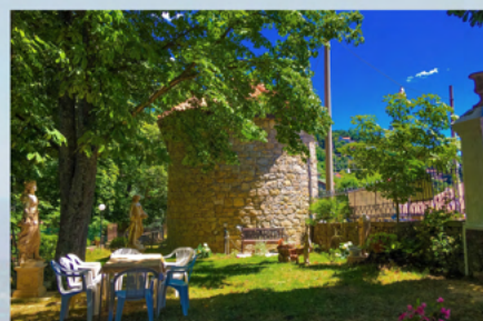
Il giardino e la cappella