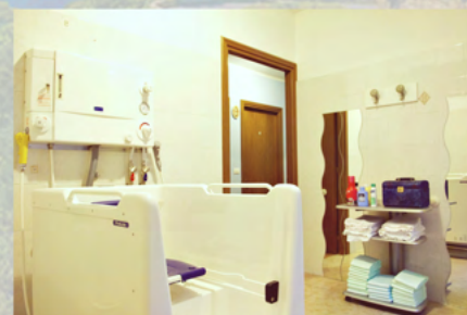
Il bagno assistito