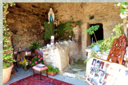
La Grotta di Lourdes