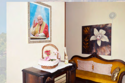
L'atrio al primo piano