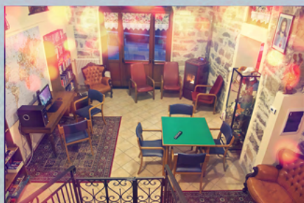
La sala animazione