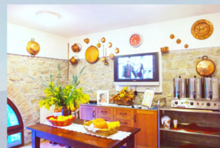
Il salone ristorante