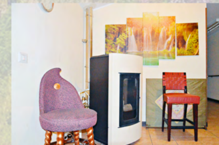
L'atrio al secondo piano