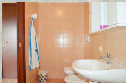
Il bagno in camera