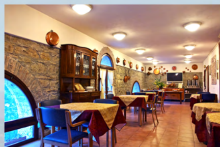
Il salone ristorante