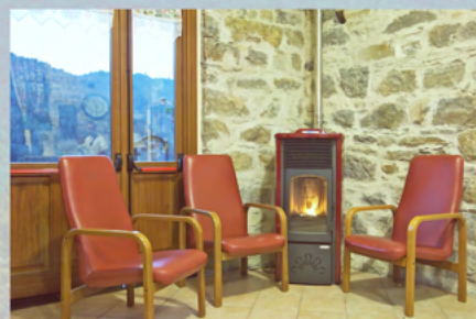
Il calore di casa