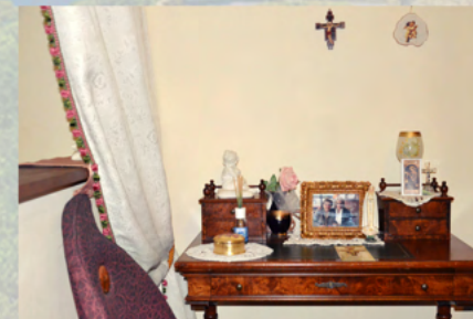
La scrivania al secondo piano